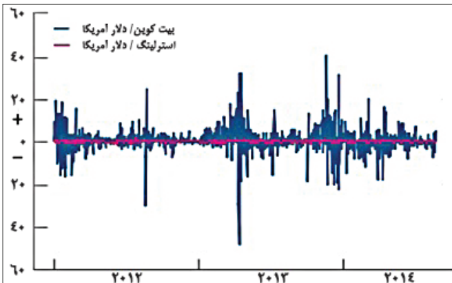
نمودار ۲- مقایسه نوسانات قیمت بیت‌کوین نسبت به استرلینگ